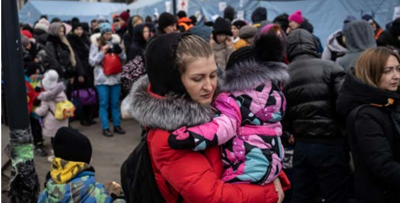
Mikil örtröð myndaðist fyrstu daga stríðsins á lestarstöðinni í Lviv í vestur Úkraínu. 90% þeirra er flúðu landið voru konur og börn.