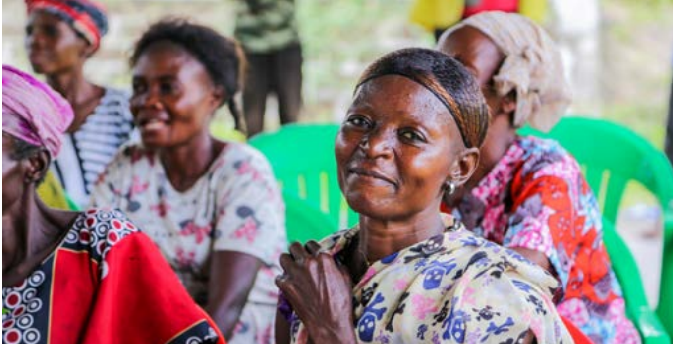
Hrísgrjónabóndi sem stundar ræktun nærri Kinshasa, höfuðborg Kongó. Kvenkyns hrísgrjónabændur hafa fengið styrk til að festa kaup á vélum sem flýta fyrir vinnu á uppskerutíma.