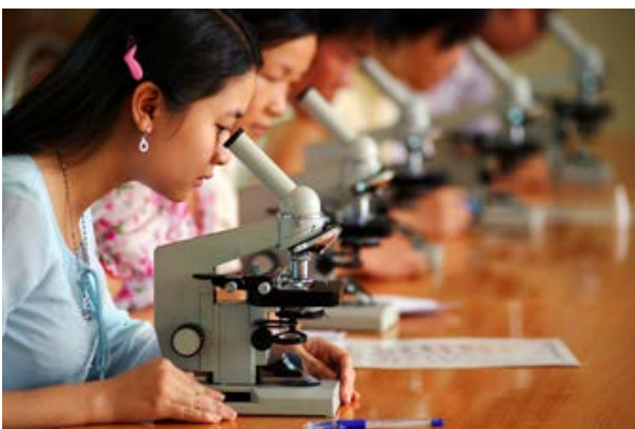
UN Women styður við menntun kvenna og stúlkna með ýmsum hætti. Aukin áhersla hefur verið lögð á að efla þátttöku kvenna í vísindum og tækni.