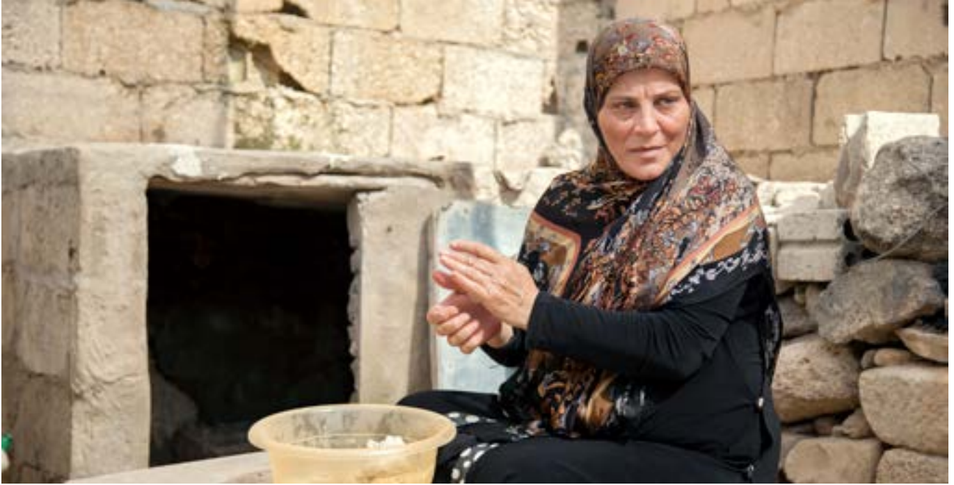
Konur á dreifbýlum svæðum í Líbanon hafa hlotið styrk til að koma á fót eigin rekstri.