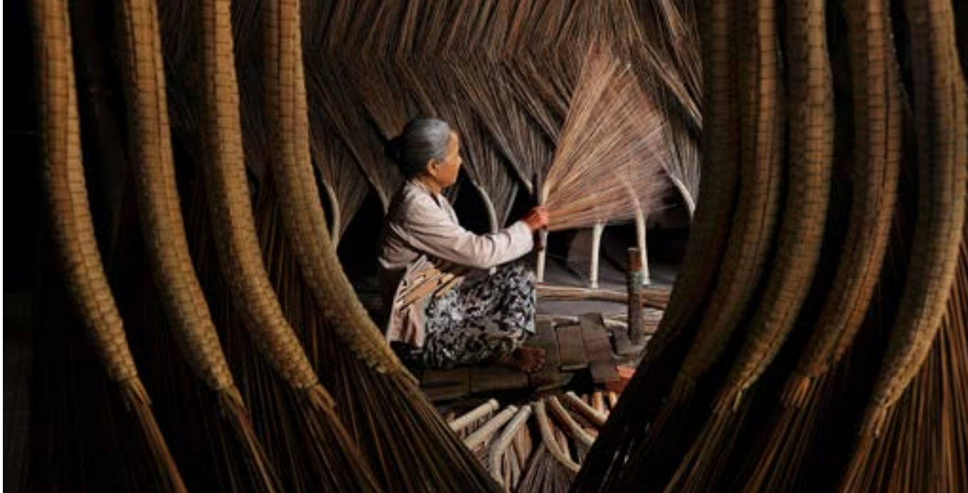
UN Women styður við atvinnuþátttöku kvenna með ýmsum hætti.