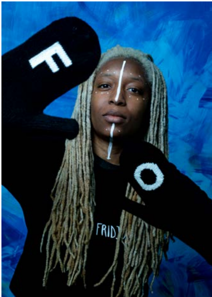
The FO campaign 2022 funded UN Women's LGBTQIA+ projects world-wide.

UN Women Iceland organized a CSW66 side event on behalf of the Prime Minister's Office in Iceland. The event was titled "The Forgotten Voices – The Impact of Climate Change on Violence Against Women" and took place on March 14 th . Panellists discussed how gender-based violence is used as a weapon of war and how it is interlinked with the effects of climate change. Guðni Th. Jóhannesson, the President of Iceland and Mr. Katrín Jakobsdóttir, Prime Minister of Iceland