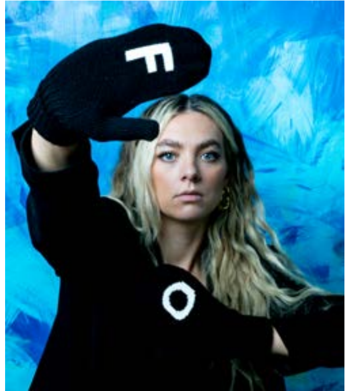
Fjötutíu hinsegin einstaklingar sátu fyrir á öllu FO herferðarefni UN Women árið 2022 og voru andlit herferðarinnar.

UN Women á Íslandi stóð fyrir viðburðinum „Moving Forward: Partnership for an Equal World“, þann 10. nóvember. Viðburðurinn fór fram í Hátíðarsal Háskóla Íslands og var Sima Bahous, framkvæmdastýra UN Women, heiðursgestur. Sem framkvæmdastýra UN Women er Bahous ein af hæstráðendum stofnana Sameinuðu þjóðanna. Því var um að ræða einstakt tækifæri til að heyra frá fyrstu hendi