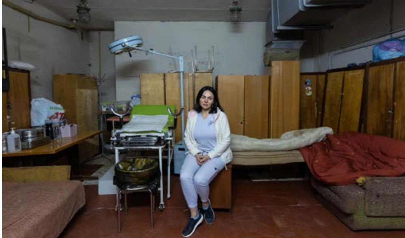
Lestarstöðin í Lviv í Úkraínu hósti mikinn fjölda fólks á flóttu. Svæðum var einnig breytt í fæðingaherbergi.

Þann 10. nóvember stóð UN Women á Íslandi fyrir einstökum viðburði með Sima Sami Bahous, framkvæmdastýru UN Women. Yfirskrift viðburðarins var „Moving Forward: Partnership for an Equal World“ og var Bahous heiðursgestur viðburðarins, sem fór fram í Hátíðarsal Háskóla Íslands. Sem framkvæmdastýra UN Women er Bahous ein af hæstráðendum stofnana Sameinuðu þjóðanna. Því var um að ræða einstakt tækifæri til að heyra frá fyrstu hendi um stöðu mála og áherslur UN Women á heimsvísu. Í erindi sínu ræddi Bahous um mikilvægi samstarfs UN Women við Ísland og hvatti til áframhaldandi samstarfs í þágu jafnréttismála. Hún þakkaði einnig Íslendingum sérstaklega fyrir þeirra ómetanlega framlag í þágu jafnréttis og UN Women.