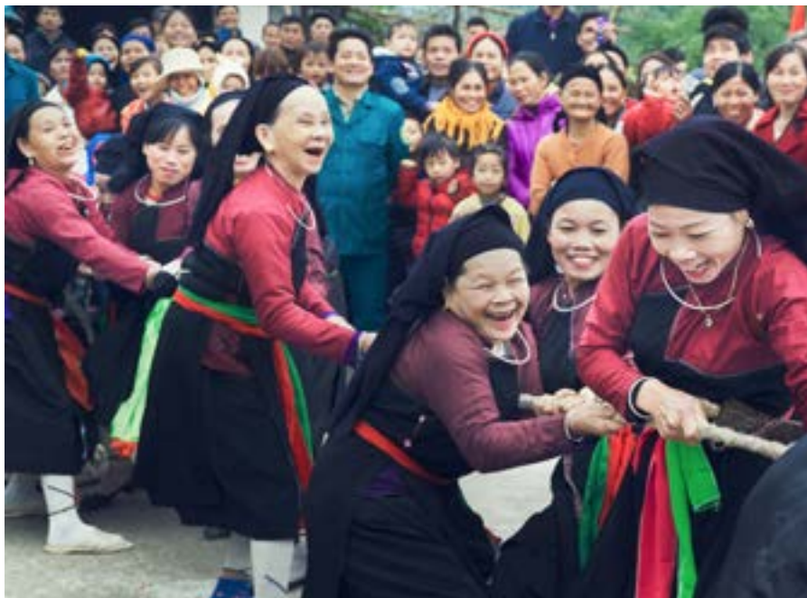
Víetnamskar konur reyna fyrir sér í reipitogi.

Í heildina var 60% af söfnunarfé samtakanna sent til verkefna UN Women, en stjórn UN Women á Íslandi í samtali við UN Women höfuðstöðvar, ákvað að halda eftir meiri hagnaði en gert hefur verið undanfarin ár. Ákvörðunin var tekin með það fyrir augum að auka varasjóð samtakanna og þar með rekstrarfé landsnefndarinnar. Þessi ákvörðun er í samræmi við ábyrgan rekstur og góða stjórnarhætti þar sem áherslan hingað til hefur ávallt verið að senda alla innkomu til verkefna UN Women á heimsvísu á kostnað þess að byggja upp varasjóði landsnefndarinnar.