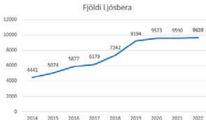
Mynd 1 sýnir þróun á fjölda mánaðarlegra styrktaraðila UN Women á Íslandi frá 2014-2022

Frá árunum 2014 til 2019 fjölgaði Ljósberum gífurlega á milli ára en eftir 2019 hægðist verulega á fjölgunum. Það er þó jákvætt að enn er ávallt um aukningu að ræða. Í árslok 2022 var heildarfjöldi Ljósbera 9.639 samanborið við 9.590 í árslok 2021. Heildarframlög Ljósbera hækkuðu úr 188.291.335 kr í