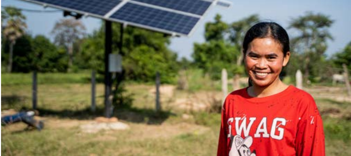
UN Women rekur verkefnið EmPower í Kambódíu sem miðar að því að koma á endurnýjanlegri orku til kvenna í atvinnurekstri á dreifbýlum svæðum landsins.