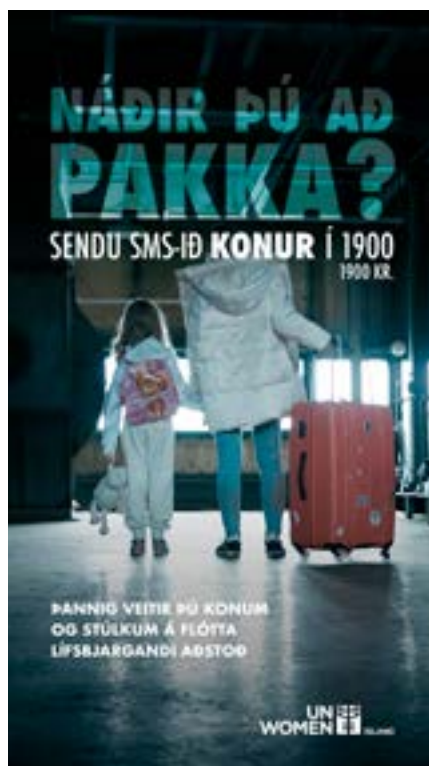
The campaign Did you have time to pack? was extremely successful

UN Women's youth council is composed of seven young individuals between the ages 16 and 30. Its members are vital to UN Women