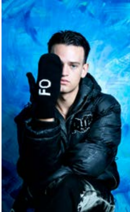
FO vettlingarnir seldust einstaklega vel.

Söluhæsta táknræna gjöfin var sem fyrr segir Neyðaraðstoð Úkraínu. Neyðarpakki Afganistan fylgdi fast á eftir, en hann inniheldur nauðsynjar á borð við fjölnota tíðarvörur, tannbursta, tannkrem, þvottaefni og nærfatnað. Einnig seldist vel af Mömmupakka fyrir nýbakaðar mæður í Zaatari flóttamannabúðunum í Jórdaníu. Í Zaatari starfrækir UN Women gríðastaði fyrir konur og börn þeirra og tryggir þeim skjól, atvinnutækifæri, daggæslu og sálræna aðstoð. Námsstyrkurinn var jafnframt vinsæl gjöf og veitir stúlku í Malaví sem hefur verið leyst úr þvinguðu barnahjónabandi námsgögn og skólabúning.