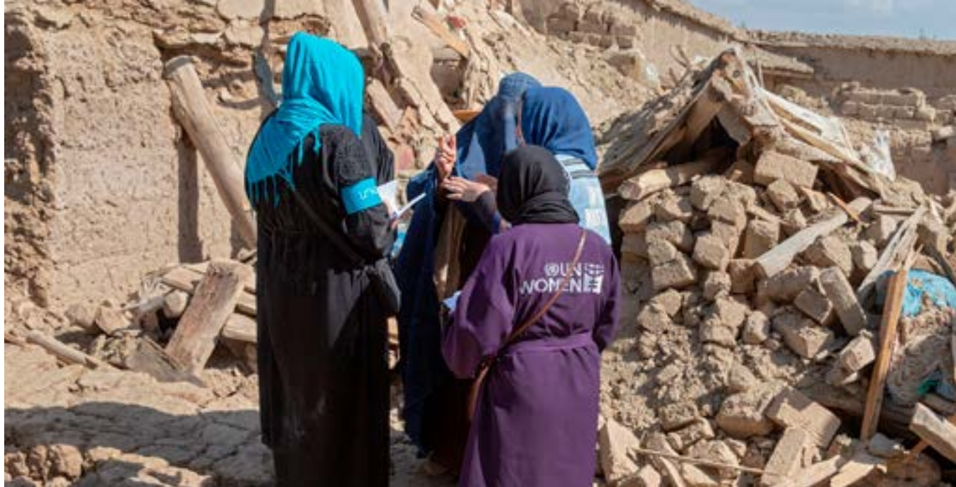
UN Women í Afganistan á vettvangi jarðskjálftanna sem riðu yfir austurhluta landsins í júní 2022. Paktika héraðið í Afganistan varð hvað verst úti.

197.711.120 kr á milli 2021 og 2022 og hækkar því heildarfrárhæðin um 5% þrátt fyrir innan við 1% fjölgun Ljósbera. Ástæðan þar að baki er öflugt starf fjáröflunardeildar UN Women á Íslandi. Ekki síst skipulögð samskiptaáætlun þar sem tengsl við styrktaraðila og fræðsla til þeirra skilar sér í því að Ljósberar hækka framlag sitt til samtakanna í gegnum hækkunarsímtal úthringistarfsfólks. Það er lykilatriði í ferðalagi styrktaraðilans (e. Donor journey), að vel sé haldið utan um Ljósberana okkar frá fyrsta framlagi til að koma í veg fyrir að styrktaraðili hætti sem Ljósberi en sé þess í stað líklegri til að hækka framlag sitt. Auk þess má nefna ný lög sem samþykkt voru í nóvember 2021 sem fela í sér heimild fyrir aðila til að draga allt að 350.000 kr á ári frá skattskyldum tekjum sínum vegna framlaga til góðgerðarmála. Nýju löggin gera það að verkum að núverandi Ljósberar geta hækkað mánaðarlegt framlag sitt um u. þ. b. þriðjung, án þess í raun að greiða meira úr eigin vasa.