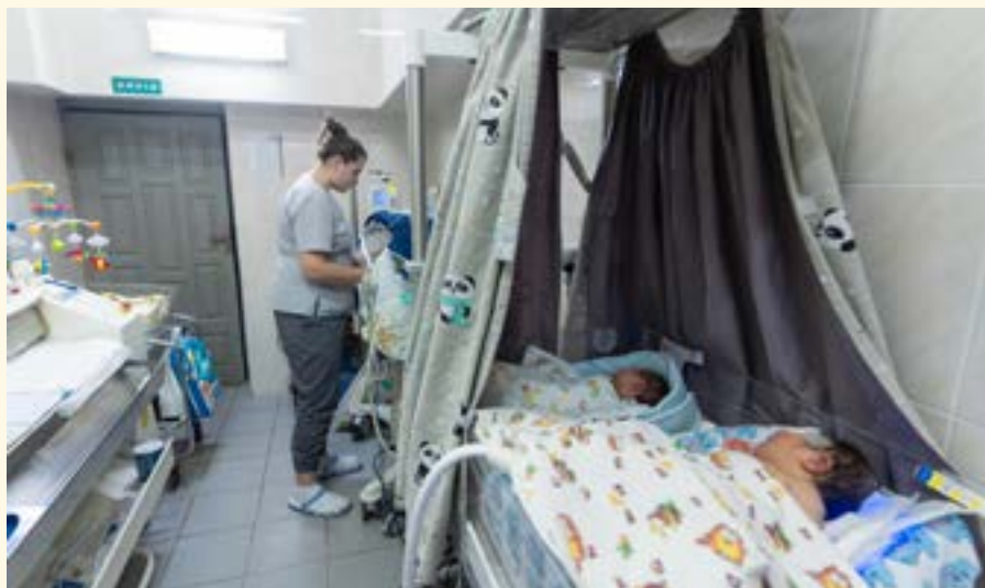
Ljósmyndir að störfum í kjallara sjúkrahúss í Úkraínu.