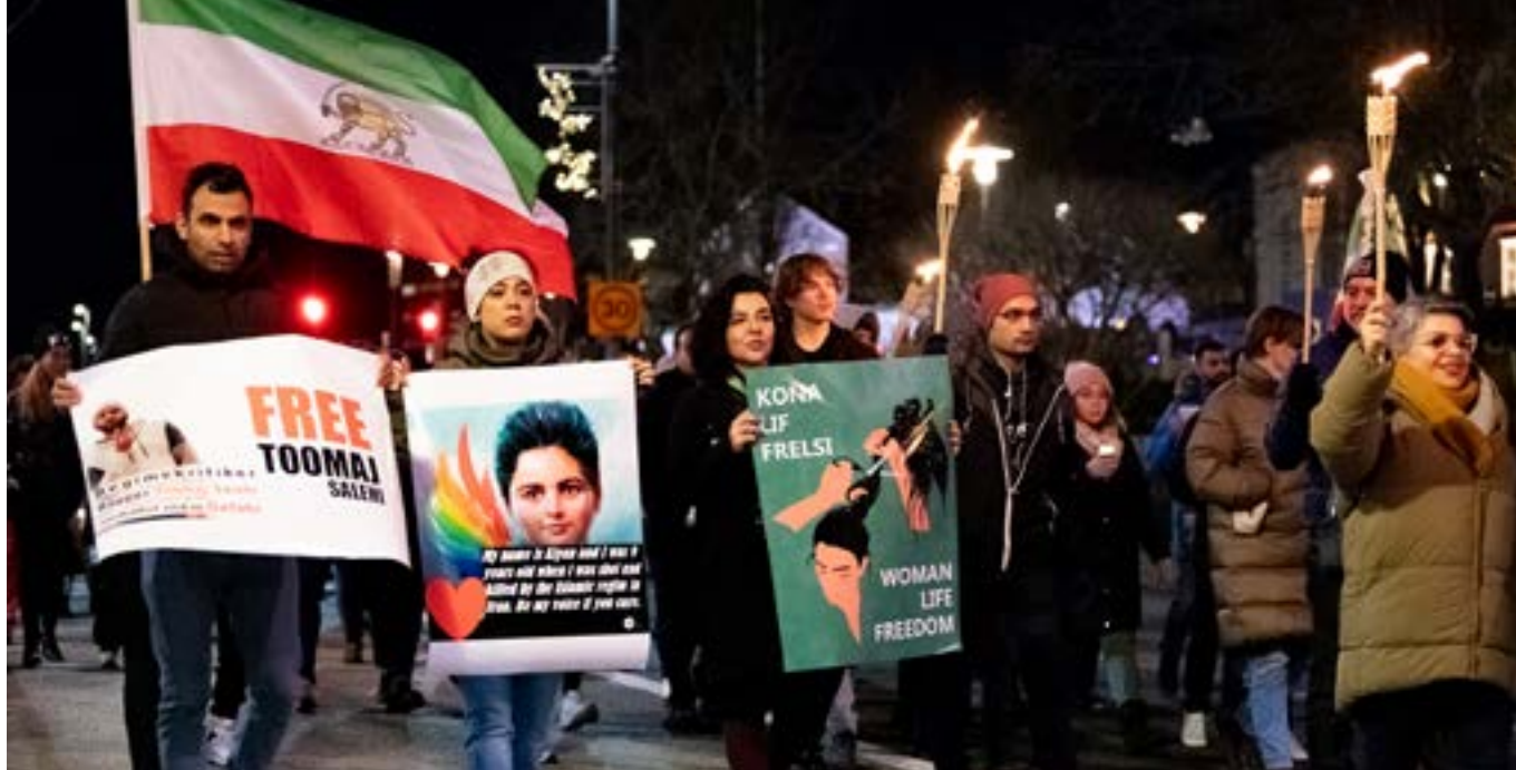
Ljósaganga UN Women á Íslandi fór fram í fyrsta sinn í nóvember 2022 eftir tveggja ára hlé sökum samkomutakmarkana.