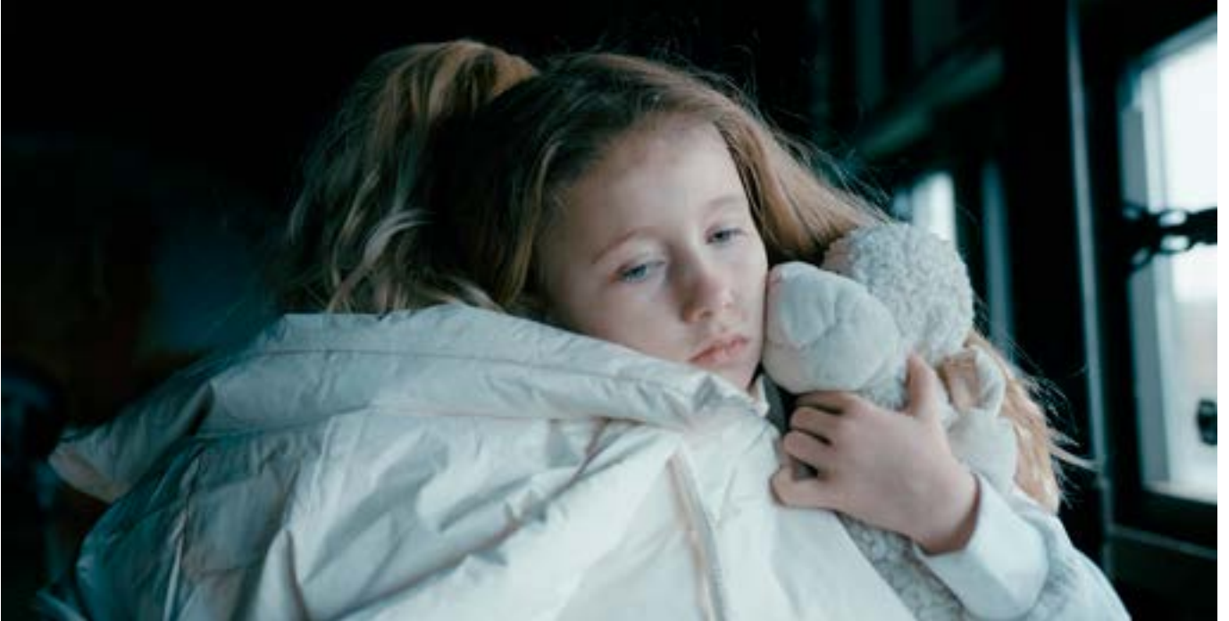
Herferðin Náðir þú að pakka? vakti athygli á áhrifum stríðs og hamfara á líf kvenna og stúlkna.