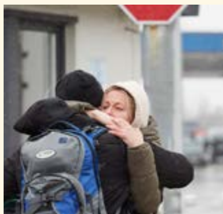
Kona kveður maka sinn við landamæri Moldóvu. Karlmönnum var meinað að yfirgefa landið.

Meðal verkefna UN Women í Úkraínu er að tryggja þolendum kynbundins ofbeldis viðeigandi aðstoð og sjá til þess að stofnanir, félagasamtök og stjórnvöld séu meðvituð um hvernig eigi að meðhöndla tilkynningar um slík mál. Þá hefur stofnunin barist fyrir